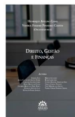
Direito, Gestão e Finanças