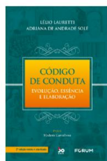
Código de Conduta: Evolução, Essência e Elaboração – A ponte entre a ética e a Organização