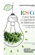
ESG: O Cisne Verde e o Capitalismo de Stakeholder – A Triade Regenerativa do Futuro Global