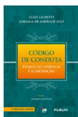
Código de Conduta: Evolução, Essência e Elaboração – A ponte entre a ética e a Organização