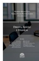
Direito, Gestão e Finanças