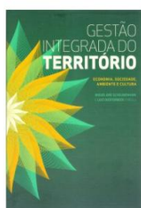
Gestão Integrada do Território: Economia, Sociedade, Ambiente e Cultura