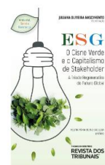
ESG: O Cisne Verde e o Capitalismo de Stakeholder – A Triade Regenerativa do Futuro Global